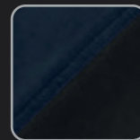
marine- schwarz #30