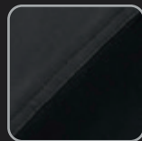
anthrazit- schwarz #28