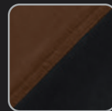
haselnuss- schwarz #29