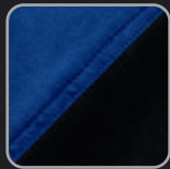
kornblau- schwarz #20