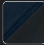
marine- anthrazit #36