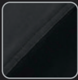
anthrazit- schwarz #28