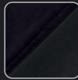
schwarz- anthrazit #35