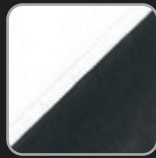
weiß- anthrazit #34